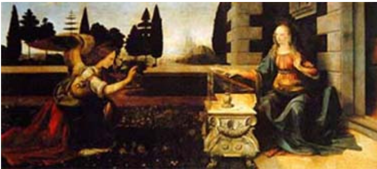
Leonardo da Vinci, Anunciação, 1472. 217 x 98 cm.

Observe com atenção as pinturas: uma é renascentista e a outra é barroca. Elas retratam uma mesma passagem bíblica: o momento em que o anjo anuncia a Maria que ela será a mãe do filho de Deus.