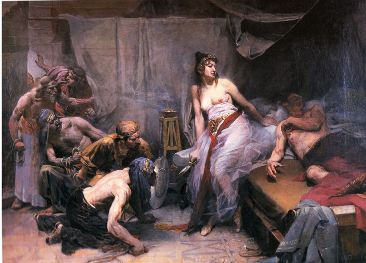
OSCAR PEREIRA DA SILVA: Sansão e Dalila , 1893. Óleo sobre tela, 59 x 78,1 cm. Rio de Janeiro, Museu Nacional de Belas Artes.