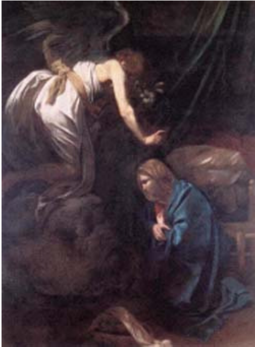
Caravaggio, A anunciação , 1609. Óleo sobre tela, 285 x 205 cm. Iconografia Moderna