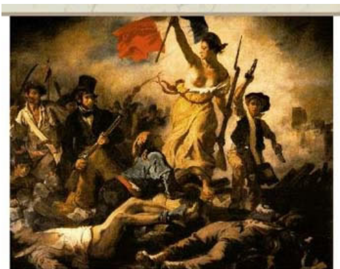
A liberdade guiando o povo - Eugène Delacroix Museu do Louvre, Paris - (XIX)

2º ano- substitua as telas por outras do Romantismo/Arcadismo, ou textos dos autores. Elabore o enunciado conforme o tema das telas.